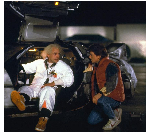
RETOUR VERS LE FUTUR, de Robert ZEMECKIS