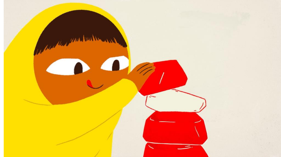
Vive le vent d'hiver !, programme de courts métrages

Programme du mercredi 23 novembre au mardi 29 novembre 2022